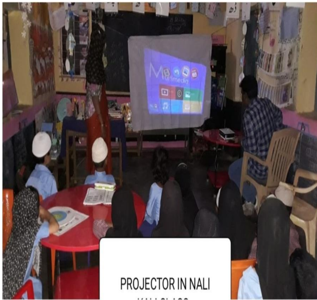
PROJECTOR IN NALI

ಮಕ್ಕಳ ಸ್ವ-ವೇಗದ ಕಲಿಕೆಗೆ ಸಹಕಾರಿವಾಗುವಂತೆ ವಿಷಯವಾರು, ಮೈಲುಗಲ್ಲವಾರು ಮೆಟ್ಟಿಲುಗಳಿಗೆ ಅನುಕೂಲವಾಗುವಂತೆ ಶಿಕ್ಷಕರು ಹಾಗೂ ಮಕ್ಕಳು ತಯಾರಿಸಿರುವ ಕಲಿಕಾ ಸಾಮಗ್ರಿಗಳನ್ನು ಮಕ್ಕಳ ಕೈಗೆಟುಕುವಂತೆ ಜೋಡಿಸಿರುವುದು ಕೊಠಡಿಯ ಅಂದವನ್ನು ಹೆಚ್ಚಿಸಿದೆ.