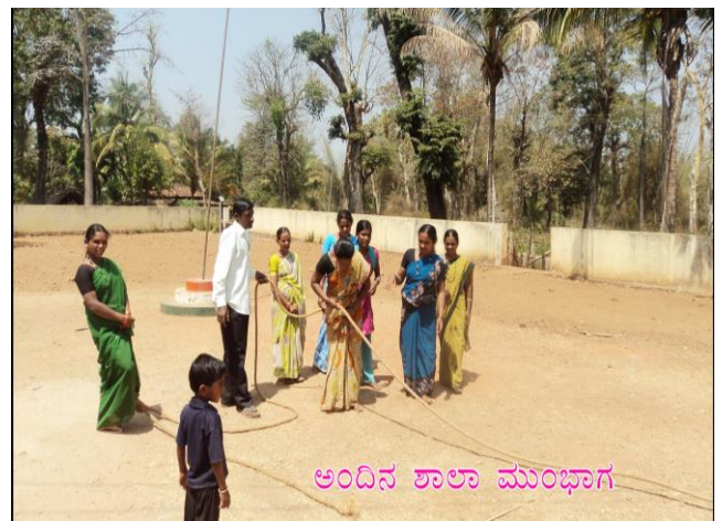
ಅಂದಿನ ಶಾಲಾ ಮುಂಭಾಗ