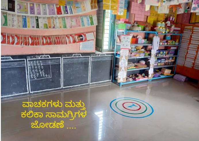
ವಾಚಕಗಳು ಮತ್ತು ಕಲಿಕಾ ಸಾಮಗ್ರಿಗಳ ಜೋಡಣೆ ....