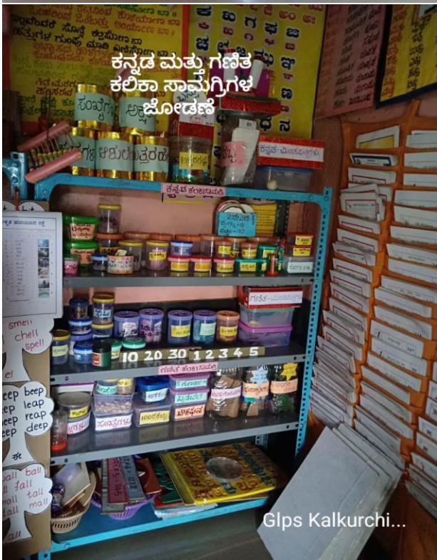
ಕನ್ನಡ ಮತ್ತು ಗಣಿತ ಕಲಿಕಾ ಸಾಮಗ್ರಿಗಳ ಜೋಡಣೆ